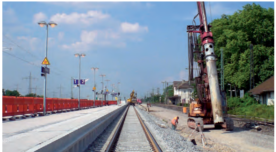
Neue Gleise und neuer Mittelbahnsteig in Schliengen

Mit der mittlerweile 8. Informationsveranstaltung informierte die Bahn im Juni 2010 über den Stand der Bauarbeiten zwischen Schliengen und Bad Bellingen. Der rund 3,2 Kilometer lange Abschnitt liegt im Planfeststellungsabschnitt 9.1 und bildet den nördlichen Anschlussbereich des Katzenbergtunnels. Treffpunkt war der Bahnhof in Schliengen, hier konnten sich die knapp 30 interessierten Teilnehmer vor Ort nicht nur den neuen 210 Meter langen und acht Meter breiten Mittel-Bahnsteig ansehen, sondern auch den Einbau der neuen Gleise beobachten.