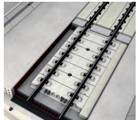
Feste Fahrbahn und Erschütterungsschutz-System in der Draufsicht

Das LMFS wird im Katzenbergtunnel zusammen mit der Festen Fahrbahn eingebaut. Deren Bau beginnt im letzten Quartal dieses Jahres am Südportal des Tunnels und zieht sich sukzessive nach Norden fort. Bad Bellingen wird voraussichtlich im Frühjahr 2011 erreicht. ■